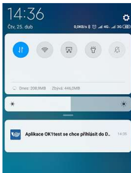
Obrázek 2 - vzhled notifikace v liště

Applikace periodicky (např. každou vteřinu) kontroluje status přihlašování na adrese: https://[adresa_prostredi]/as/mepWsStateUpdate s S-COOKIE získanou v předchozím kroku.